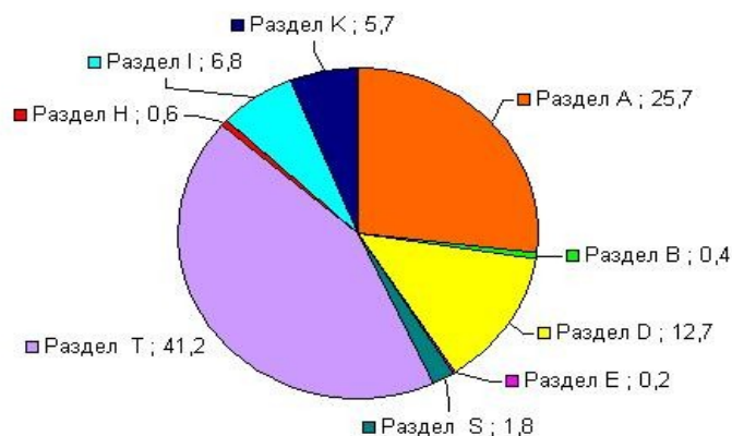
Удельный вес индивидуальных предпринимателей по отраслям экономики, %