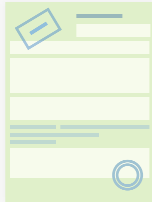
Страховой полис ОСАГО с электронной подписью

После оплаты в ваш личный кабинет и на e-mail придут электронные документы, которые вы можете распечатать: